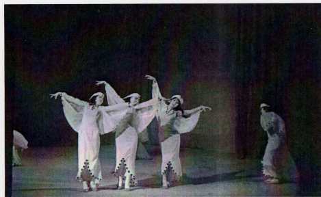
Первые чайки Гиль

... Назавтра мы идем к морю. Холодно. Погода предштормовая – состояние природы близко к нашему настроению. Что можно почерпнуть из этой прогулки? Все смотрят в разные стороны, оглядываясь. И тут слышим голос Александра: