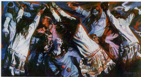
Картина Вадима Санакоева «Танцующие чайки»

воспроизведения криков чаек во время исполнения танца, имитации полета над водой, особой пластики рук, когда при неподвижном корпусе руки создают ощущение полета. Хореограф старался не нарушить основные принципы пластического воспроизведения содержания, характерного для танцевальной культуры коренных малочисленных народов Камчатки – это импровизация, пантомима, имитация, подражание. Гиль сумел соединить фольклор с современной хореографией.