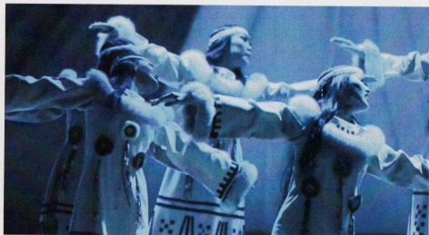
Ансамбль «Мэнго» танец «Чайки»

перед зрителями необыкновенный образ казаков.