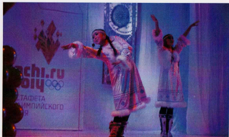
Ансамбль «Ангт», танец «Чайки»

премущественности, этнокультурных связей между народами, отметила: «Прямая передача традиций хореографии от поколения к поколению дает возможность не только выявить особенности традиционного танца каждого народа и черты их этнического единства в прошлом, но и проследить в пути развития, взаимообогащения хореографии различных народностей...» [Жорницкая, 1973, с.26].