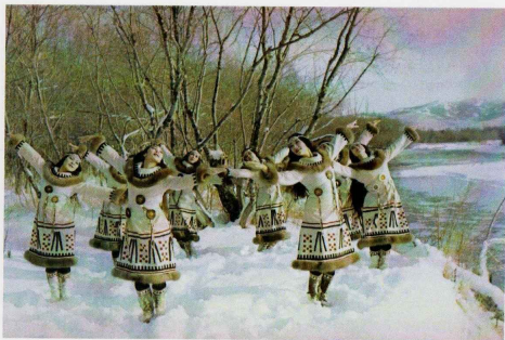
Ансамбль «Мэнго» танец «Чайки»

по традиционной жизни, состоящей из занятий рыболовством, выпасом оленей, смотрел домашнюю утварь, та, что находилась внутри дома и вне дома, яранги. Почему шкуры зашиты, словно вывернуты наизнанку, а так раньше просушивали на морозе шкуру оленя.