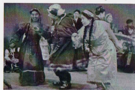
Ансамбль «Хаилинские девчата»

Есть в небольшом северном селе Хаилино коллектив, играющий роль особую, невероятно ответственную. Называется он «Чекнитон» (в переводе с корякского — «Родник»), раннее его название «Хаилинские девчата». В 1961 году при сельском Доме культуры с. Хаилино был создан фольклорный самодеятельный