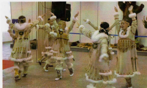
Ансамбль «Орьякан» танец «Чайки»

В 2011 году по приглашению коллег из МБУ «Детско-юношеский эстетический центр «Кыталык», Камчатский центр народного творчества направил меня в г. Якутск на I-й Республиканский творческий форум народных и образцовых коллективов Республики Саха (Якутия). В рамках