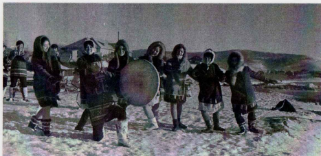
Первый состав Мэнго